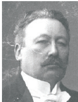
WOJCIECH TRĄPCZYŃSKI (1860–1953)

In den 17 Jahren der Tätigkeit des Senats der Zweiten Republik Polen (1922–1939) leiteten fünf Marschälle seine Arbeit. Etwas Gemeinsames verband sie: Sie fühlten sich alle der freiheitlichen Traditionen der Generation verbunden, die nach dem Aufstand 1863 ins aktive Leben trat. Sie alle waren an den Hochschulen der Teilungsmächte ausgebildet, also in Österreich-Ungarn, Deutschland und Russland. Ihr erwachsenes Leben fiel mit der Jahrhundertwende zusammen, also in den Jahren 1880 bis 1914. 1918, als Polen zum unabhängigen Leben wiedergeboren wurde, bekleideten die fünf künftige Senatsmarschälle verschiedene öffentliche Posten im In- und Ausland, darunter auch in patriotischen Organisationen. Bevor sie das parlamentarische Leben in der Wiejska-Strasse mitzugestalten begannen, übten sie verschiedene staatliche Funktionen in der Zweiten Republik aus. Ihr ganzes Leben lang interessierten sie sich für Politik und für die polnischen Angelegenheiten.