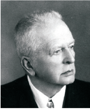
JULIAN JULIUSZ SZYMAŃSKI (1870–1958)

Senat der zweiten Amtsperiode (1928–1930)