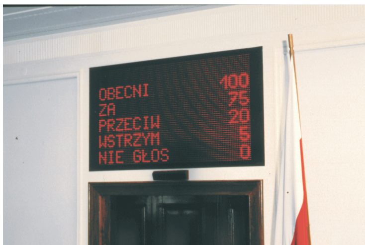
Результаты голосования на табло